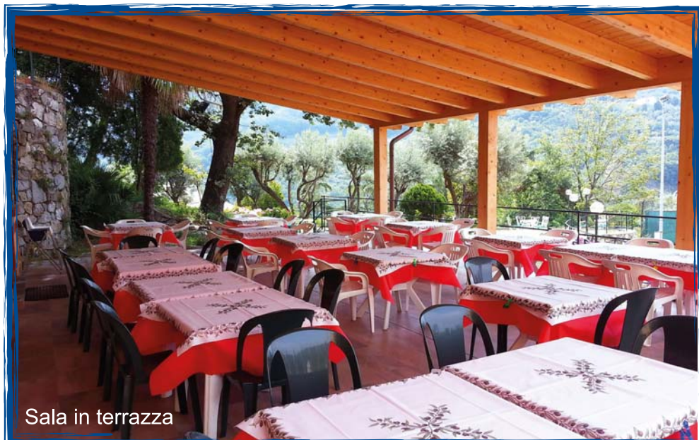
Sala in terrazza